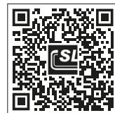
SL Rack YouTube Videos anschauen >