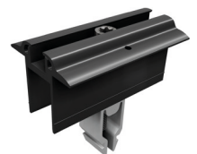
Mittelklammern Vario mit Erdungspin, schwarz eloxiert Art.-Nr. 96141-01