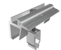
Endklammern Vario mit Erdungspin Art.-Nr. 91114-00