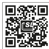
SL Rack Website Erfahren Sie mehr >