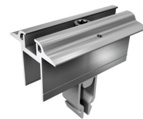
Mittelklammern Vario mit Erdungspin Art.-Nr. 91121-01