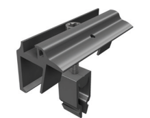
Endklammern Vario mit Erdungspin, schwarz eloxiert Art.-Nr. 96114-00

*Es gelten unsere Garantiebedingungen. Diese sind jederzeit im Internet einsehbar unter www.sl-rack.de