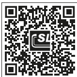
SL Rack Feedback Feedback schreiben >

Oberstes Ziel für uns ist es stets, Ihnen den Arbeitsalltag so gut es geht zu erleichtern. Deswegen ist es uns auch enorm wichtig, Ihr Lob, Ihre Kritik und auch Ihre Verbesserungswünsche zu erfahren.