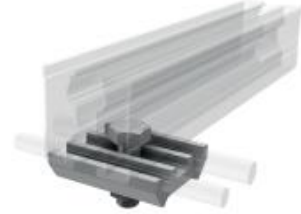
Blitzschutzklemme unten, inkl. Schraube M10 im Lieferumfang enthalten