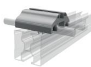
Blitzschutzklemme oben, sehr niedrige Bauhöhe für Module mit Rahmenhöhe 30 mm