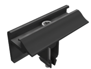
Endklemmen Vario, schwarz eloxiert Art.-Nr. 96112-00