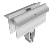
Mittelklemmen Vario mit Erdungspin Art.-Nr. 91121-01