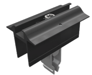
Mittelklemmen Vario mit Erdungspin, schwarz eloxiert Art.-Nr. 96141-01