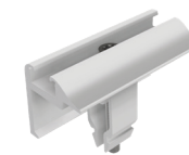
Endklemmen Vario Art.-Nr. 91112-00

Horizontal oder vertikal durch einfaches Heben und Drehen der Kralle