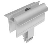
Mittelklemmen Vario Art.-Nr. 91151-01