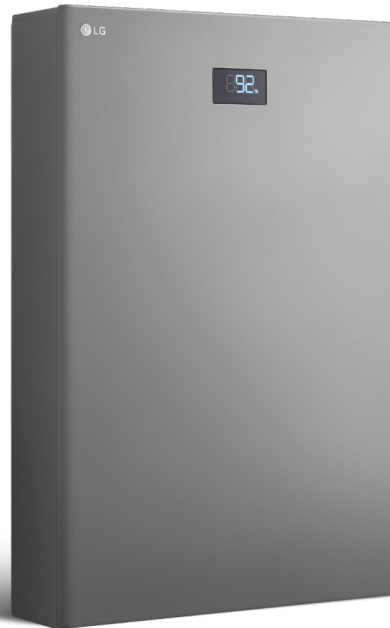
LG HBC Batterie 11H | 15H BUEL011HBC1 BUEL015HBC1

Das LG Electronics ESS ist ein modernes Home Energy System für Hausbesitzer, die Ihren Energieverbrauch zu Hause stets unter Kontrolle haben möchten. Es stellt Tag und Nacht zuverlässig Strom aus einem hocheffizienten System bereit. Dank seiner modularen Konzeption lässt sich die nutzbare Kapazität der Batterie ohne zusätzliche Geräte bis auf 28,5 kWh erweitern.