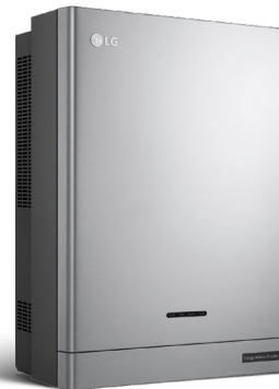
LG ESS Home 8 | 10 D008KE1N211 D010KE1N211