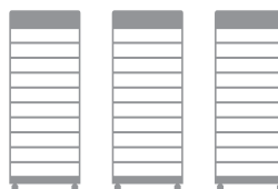
3 x HVB 29.6